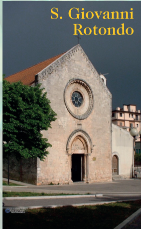
S. Giovanni Rotondo